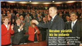
Berberah yürüdük biz bu yollarda Erdoğan, adayın açıklanması "Kıranınlar çattılar" sloganı atan partililer: "Berberah yürüdük biz bu yollarda" şarkısını söylediler.

Başbakan Erdoğan, AKP grubundaki tarihi konuşmasında "Başladığımız işi bitirmeden bırakmayız" dedi ve adayının Gül olduğunu açıkladı.