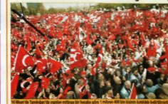
14 Nisan'da Tandoğan'da yapılan mitingde bir beşasak göre 1 milyon 600 bin kişinin katıldığı bildirildi.

Ankara Tandoğan Meydanı'nda 14 Nisan'da yapılan 1 milyon 600 bin kişinin katıldığı mitingün tekrarı yarın 13.00'te İstanbul Çarşılar Meydanı'nda düzenlenecek. "CUMHURİYET İÇİN ÇAĞLAYAN" adı verilen mitingte başta İstanbul'dan Kuruluşcular Birliği, Atatürkçü Düşünce Derneği ve Kuruluşçuların Anadolı Kuruluşları Derneği (CYD) olmak üzere 800 civarındaki kuruluşlar destek veriyor. Tandoğan'da okutulan şiir Çağlayan'da da Türk bayrağın altına başka hiçbir bayrak da bulunmaması isteniyor. Mitingde konuşan Aytemiz Alpmann "Milletimizin arkasına oynayan Hakkı Ergeçer de Atatürk'ün Genelkurmay Başkanı olarak çıkacaktır. Mitingin düzenlenmesi Komünist işyeri ve CYD'den Başbakan Prof. Dr. Tarkan Saylan "Başbakanımızın 'Çankaya'da bir ilk olacak' sözcüğü" dedi.