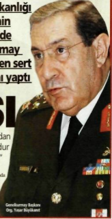
Genelkurmay Başkanı Org. Yasar Büyükanıt

Cumhurbaşkanlığı seçiminin gecesinde Genelkurmay son yılların en sert açıklamasını yaptı