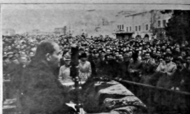
İstanbul'da seçin günü bir aday denen seçkin

Zonguldak, 5 Eylül'de başlatılan büyük atılımımızın Zonguldak Fuat Sirmen Odası... Zonguldak'ta kömür havzasının büyük ve önemli bir bölümünü kaplayan yeni maden kuyusunun ad koyma töreni dün yapıldı. Ekonomi Bakanı Fuat Sirmen, töreni başkanlık etti. Sirmen, konuşmasında, kömür havzamızın büyük ve önemli bir bölümünü kaplayan yeni maden kuyusunun ad koyma töreni dün yapıldı. Sirmen, konuşmasında, kömür havzamızın büyük ve önemli bir bölümünü kaplayan yeni maden kuyusunun ad koyma töreni dün yapıldı.