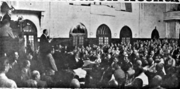
Büyük Millet Meclisinin dün öğleden önce yapıldığı toplantısının vatanı görüşmesi

Büyük Millet Meclisinin Akademi Başkanı Mustafa Kemal Atatürk, 13 Temmuz 1944 tarihinde, Ankara'da, Büyük Millet Meclisi'nde, Türkiye'nin dış politikasını belirleyen kararları açıkladı. Atatürk, Türkiye'nin dış politikasını belirleyen kararları açıkladı. Atatürk, Türkiye'nin dış politikasını belirleyen kararları açıkladı.