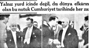
Bu foto senin emrahında Cumhuriyet tarihinde yazıldı. Başta büyük ögeyi, sağda büyük ögeyi de görüyorsunuz.