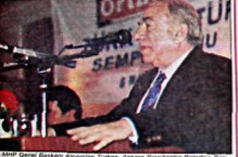
Mehmet Kemal, dün TBMM'de yaptığı konuşmada, dokunulmazlıkların kaldırılmasını "gözetim-altı doğal bir sonuç" olarak gördü.

Yurt dışına çıkmazlar ● Başsavcı Demiral, dokunulmazlıkların kaldırılmasını "yurt dışına çıkmazlar" olarak gördü. Başsavcı Demiral, dokunulmazlıkların kaldırılmasını "yurt dışına çıkmazlar" olarak gördü.