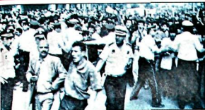
uma namaz sonrası cami önlerinde başlayan protesto gösterileri gittikçe büyüdü.