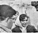
Millî Genelkurmay Başkanı Lemnitzer'in Ankara'da.

Ankara 28 (Cumhuriyet) Telihi - Cumhurbaşkanı İsmet İnönü, bir hafta içinde ikinci defa Amerikan Büyükelçisi ile görüşme yaptı. İnönü, bir hafta içinde ikinci defa Amerikan Büyükelçisi ile görüşme yaptı.