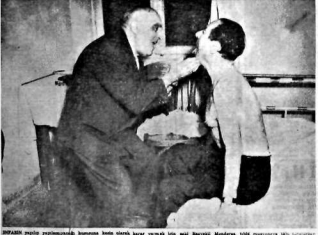
İZMİRİN YERİNE YERLEŞTİRİLMİŞ İHTİSAS İHTİSAS KESİRE DEĞİRE GÖRÜŞÜMÜZÜ ALKAN MENDERES İÇİN İHTİSAS KESİRE DEĞİRE GÖRÜŞÜMÜZÜ