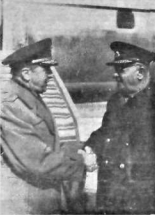
Genelkurmay Başkanı Lemnitzer'in Ankara'da.