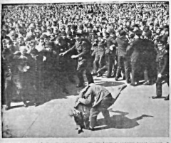
FAŞİSTLER KARŞI... İtalyanlar Parisi Müslümanlar için bir tehdit olarak görmüyorlar. Paris'te bir konferans düzenleniyor ve konferansın bir sonucu olarak bir parti kuruluyor. Bu parti, İtalyanlar tarafından oluşturulan bir parti olacaktır. Bu parti, İtalyanlar tarafından oluşturulan bir parti olacaktır.

Yayınlanan 38 kişilik liste ile üç ordunun da Kurmay Başkanları değişti Güventürk, Doğu Menzil Kumandanı oldu