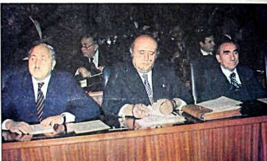
AP, MSP ve MSP Genel Başkanı, 170 gün süre baskı altında bulunan İktidarı MC 218 oyuyla geri getirdi. 229 üye meclisi geçirdiği 170 MC baskısını, 170 gün süre...

DEMİREL: Şimdi hükümet bunalımı başlamıştır ECEVİT: Ağır bunalım sona ermiş bulunuyor