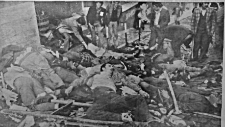
13 Mayıs sabahları İstanbul'da yaşanan olayların sonucu olarak meydana gelen can kayıplarının bir kısmı. (Caption describing the image as a scene of destruction following the events of May 13th.)

■ Başbakan Demirel toplantılardan önce «Sıkıyönetim söz konusu değildir» dedi; Ecevit: «Seçimler yapılmayınca terfileri yoğunlaşsın, kıskırtılmaya kapılmamak gerektiğini söyledi»