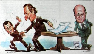
Sosyal Viyana'dan döndü