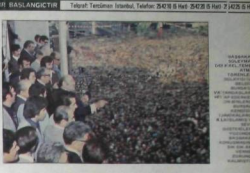
CHP LİDERİ WALDORF ASTORIA'DA TÜRKLERLE GÖRÜŞÜRKEN TABANCAŞINI ÇEKEN GENÇ RUM'U BİR ABO DIŞIŞLARI YETKİLİSİ KİŞİKIRAK YAKALADI

Başbakan, Türkiye'nin Keban'dan sonra ikinci büyük barajı olacak Doğanın kır koyarken «Başlanmış değil, başlanacak eserlerin teminini atıyoruz» dedi