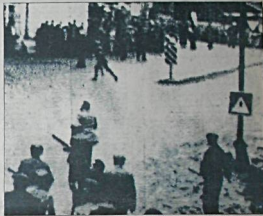
CHP Genel Başkanı Ecevit'in saldırı saldırısına uğradığı Tokat'ta Nisnar ilçesinde jandarmaların görevini üstleniyor...