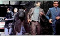
Suudi Paten Amir Başbakan için görüldü bomba ve ateşlele saldırı yapıldı. Birçok kişi yaralandı ve bazıları hayatını kaybetti.