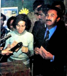
"Seçimler milletimize hayırlı olsun"