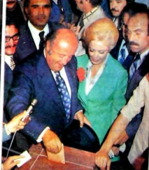
"Biz konuştuk. Bugün söz milletindir"