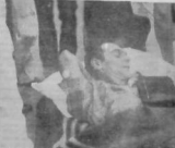
Özellikle Almanya'ya tedavisi için gelen Türk işçileri AP Halkla İlişkileri Genel Sekreteri.

Demirel'in başkanlığındaki hükümetin 31 üyesi arasında 15 üyesi AP, 11 üyesi MSP, 5 üyesi MHP ve 1 üyesi DTP'den oluşuyor.