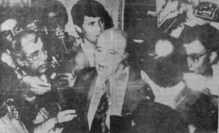
Demirel başkanlığında kurulan AP, MSP, MHP koalisyon hükümeti dün Cumhurbaşkanlığına girdi. Fotoğrafta Demirel'in başkanlığındaki hükümet üyeleri.

MOSKVA (THA) — (TASS) — Sovyet Dışişleri Bakanı Andrei Gromyko, Sovyetler Birliği'nin Mısır ile ilişkilerini düzeltmeye hazır olduğunu bildirdi.