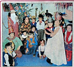
Minikler yeni yıla bir gün önce giriş hediyelelerini aldı

● 1977'deki vahşet ve kırımın unutulmasını istediler