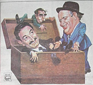
— Gel atma ayetima, bize de suçlucama bir yer bırak...

İçinde bulunduğu seçim otobüsü ateşe tutulan CHP Genel Başkanı, «Bu, AP ile MHP'nin birlikte hazırladıkları bir oyun» dedi