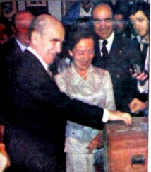
"Söylemek istediğim iki kelime var"