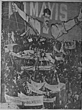
İşçiler törenlerinde ve sokaklarda düzenlenen gösterilerde 1 Mayıs mottosu '1 Mayıs İşçiler için aydır, proletarya için aydır' sloganıyla kutlanıyor. Nispetiye'deki törenlere katılan işçiler, gösterileri büyük coşkuyla sürdürüyorlar.

bu törenlerde yer alan bazı kişiler için de... (The text continues with details about the participants and the atmosphere of the event.)