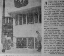
AP Genel Merkezi'nin bomba saldırısı sonucu tahrip olduğu görülen binanın depo kısmı ile Basın Bürosu tahrip oldu, butun camlar kırıldı.

ANKARA (HA) - İş Bankası'nda astronomik zam.