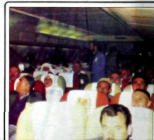
Bu Türk hane ailesinin, diğer ÇM'ye giren hane aileleri 7 farklı Hıristiyanlık mezhebi olan Katolik, Ortodoks, Protestan, Ermeni, Yunan Katoliki, Ortodoks ve Protestan mezheplerinden oluşmaktadır.

NATO kaynakları özellikle Ege'deki kontrol alan sorunuyla ilgili Türkiye ile Yunanistan arasında bir uzlaşma formülünün bulunduğu belirtiliyor. Varılan anlaşmaya göre Yunanistan, NATO'ya 1978 öncesi şartlarıyla dönmek üzere vizesiz ve Ege'deki komutanlık görevi bir NATO komutanına veriliyor.