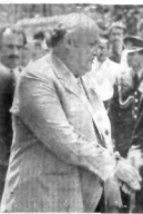
Erim ve Demirel Erim Etiler mezarında toprağa verildi.

İstanbul Haber Servisi - Erim Başbakan ve Cumhurbaşkanı İsmet İnönü'nün torunu olan Erim'in cenazesi üç gün süreyle İstanbul'da kılınacak törenlerle toprağa verilecektir. Erim'in cenazesi üç gün süreyle İstanbul'da kılınacak törenlerle toprağa verilecektir. Erim'in cenazesi üç gün süreyle İstanbul'da kılınacak törenlerle toprağa verilecektir.