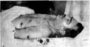
SALDIRIYAKARŞI KURBANLARIYA ADIY KALKILAN TÜRKLER HASTANEYE GÖTÜRÜLDÜREN ÖLÜDÜ.