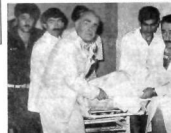
SÖNEN CİSSEİ AMELİYATI TAŞINIRIN