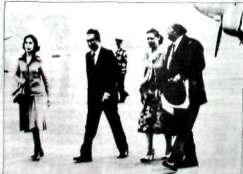
29 GÜN SONRA: Nilüfer Ecevit ve eşi ile Süleyman Demirel ve eşi. 22 Eylül 1980'den tam 29 gün sonra. Demirel ve Ecevit, 29 Eylül'de Ankara'da bir araya geleceklerdir.

ANKARA (A.A.) Devlet Başkanı Süleyman Demirel, yarın Diyarbakır'a gidecek. Demirel, Diyarbakır'da 12 Eylül'den önceki günleri hatırlatan bir konuşma yapacak. Demirel, Diyarbakır'da 12 Eylül'den önceki günleri hatırlatan bir konuşma yapacak. Demirel, Diyarbakır'da 12 Eylül'den önceki günleri hatırlatan bir konuşma yapacak.