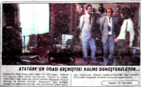
ATATÜRK'ÜN ODASI GEÇMİŞTEKİ HALİNE DÖNÜŞTÜRÜLÜYOR...

Yedek subaylık tasarı MGK'nin onayına sunuldu • Tasarıya göre, Silahlı Kuvvetlerin ihtiyacı kadar aday yedek subay olarak yetiştirilecek. Tasarı halinde istatistikler ne-zar-da olacak. Yedek subaylık süresi 18 ay, erbaş-er oğlars aynılardan önce ise süre 9 ay. • Millî Güvenlik Konseyi tasarıyı kısa süre içinde kabul edilecek yürürlüğe gireceği umidinde olduğunu söyledi Haberi 10. Sayfada