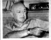
ERİM 12 MART SOĞANININ BASKARINI İZİ

De bir ifadeyle yazılmıřtır. "Gözetim Anadoluluların..."