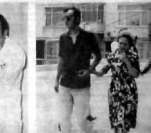
AĞABEY KİMAL ERİM VE TAĞIRLARI HASTANEYE GİRDİKİN