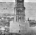
Dün Kurluluşundan kutlanan güzel Edirne'nin den birşık manzara: Şehit, saat kulesi, Meriç.

Edirne, 25 (A.A.) — Bugün Edirne'nin kurtuluş bayramıdır. Bu mutlu günü de seneler her yıldan daha parlak ve daha coşkulu sarıttı bulunmasını işin hatırlayıcıları yashınmış olan barışlar bir künüşü. Şöhr bayraklar, taktlar, kürsüler, tribünler ve şüphelikle süs-