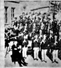
Şehir bandosunun çocukları Erarazığı bir şekilde şehre giren ve şirâtki çalmalarıyla (Lütfen sarfıya) çektirir.

Ankara'da Romen çalgıcları defedilmeleri emrine muvafık intizar ediyoruz Ankara, 24 (Telefon)—Romen çalgıcları mesleki etrafında gâzetenim yaptığı neşriyat alâkadar mahabifede ciddiyette takip edilmektedir. Hariciye ve Dahiliye vekâletleriyle Emniyeti umumiyeye müdârilik ehemmiyetle tetkikat yapılmaktadır. Mukabele bilimsel muamelesinin pek yakında tatbik olunması, bu suretle Romen çalgıclarını defedilmeleri muhakkak addolunmaktadır.