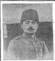
Mustafa Kemal Paşa'nın gizli plânları hakkında Mustafa'ya sorulmuş olduğu gibi almanya askerlerine sorulmuş