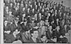
Dün kendilerine teahat verilen sayın memurları

Mesele Kamutaya pazartesi günü görülecektir.