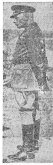
General Milne'nin bir İngiliz askerinin fotoğrafı. Başbakan Damat Ferit'in terkiif edilmesini istediği kişilerin başbakanın talebi üzerine, millicilerden 80 kişiyi İngilizlere terkiif edilmesini istediği, İstanbul'da büyük bir heyecan uyandırdı.

İstanbul 10 Ağustos Pazartesi. — Damat Ferit'in, İngiliz amiralinden başbakanın talebi üzerine, millicilerden 80 kişiyi İngilizlere terkiif edilmesini istediği, İstanbul'da büyük bir heyecan uyandırdı.