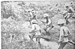
Harp sahnesinde bir İtalyan müzresi

Adisababa 17 (A.A.) — İtalyan uçakları dün kezce cephesindeki faaliyetlerini Ambo Alaja kadar uzatmış ve bu yerli bombardıman etmişler. Sivillî halk arasında bir çöküş oldu. Fakat şehrinde hiç asker olmadığı için kaza arasında hiç zayıf olmadıkları bildiriliyor.