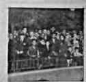
Solda Karadeniz Boğazını işgal eden istatistiksel ait teyfel vapuru yükletilene, yukarıda Tekeles merkezinde muahedinin imzası baharini beklenen halk

Dia gendesi "İstanbul, her tarafta ve herokte tarihî ferikinde bir sevinç buluyor. Boğazlar mukavelesinin inna edildiği (Devran 2 ü sayfa)