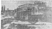
Erzurum Kongresi'nin açılışında Mustafa Kemal.