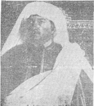
Mustafa Kemal Paşa'nın İstanbul'da toplanan 1919 Kongresi'ne katılması...